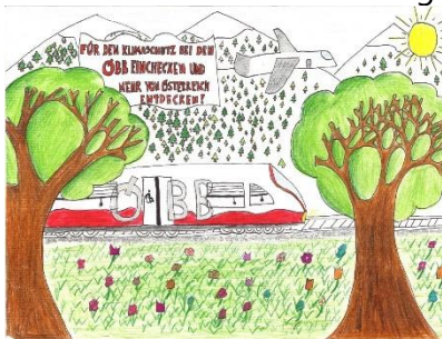
Platz 1: Marlene Mitmasser Stiftsgymnasium Melk