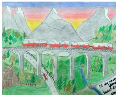
Platz 2: Julia Weißinger SMS Zwettl